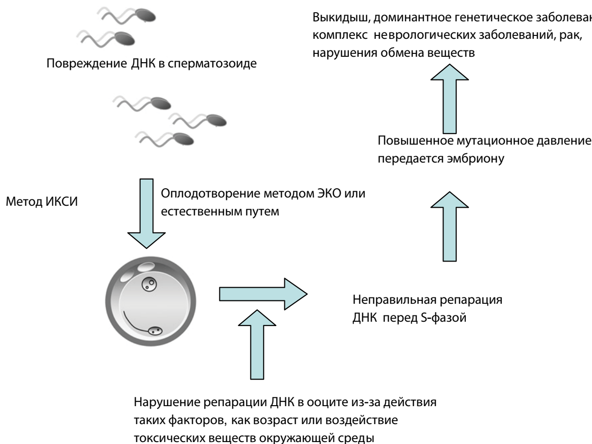
Рис. 2. Влияние фрагментации ДНК сперматозоидов на фертильность (по R.J. Aitken et al., 2011) [61]

Недавно предложен новый метод детекции повреждения ДНК сперматозоидов, основанный на применении синтетического пептида, состоящего из 21 аминокислоты (DW1), связанного флуоресцентным красителем Rhodamine В в взаимодействующего с критическим регионом р53 [63]. Хотя DW1 в на-